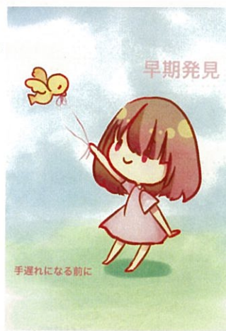
イラスト:新谷有那 (福井工業大学附属福井高等学校 卒業生)