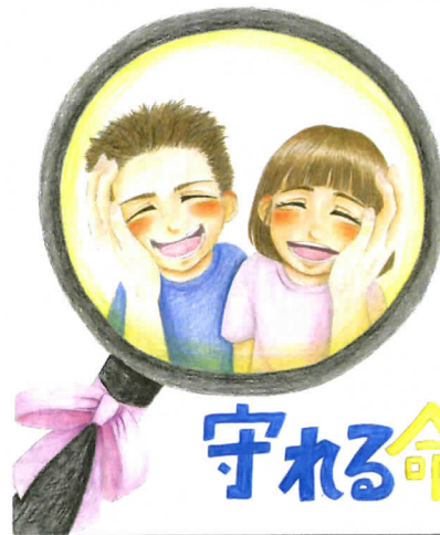
イラスト: 杉本ひまり(福井工業大学附属福井高等学校)